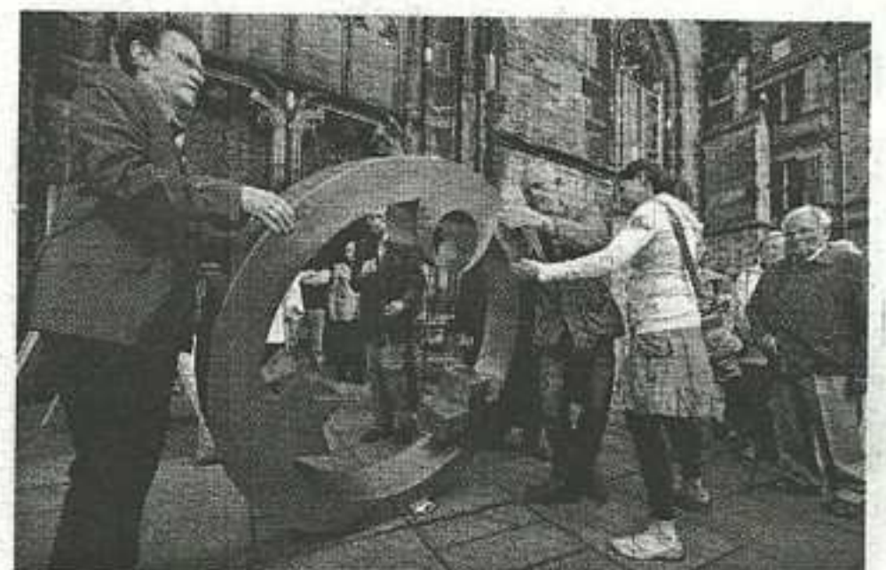
Auf dem Boden vor der Salvatorkirche wurde mit Hilfe dieser Stahl-schablone eine Engelsfigur aus Sand gefertigt.

Dicht von Besuchern umringt war stets die aus Bronze gegossene und mit Wasser gefüllte Klangschale, die in der Duissemer Lutherkirche aufgebaut war. Mit befeuchteten Handflächen galt es, über die beiden Handgriffe zu reiben – schon entstand ein Ton. Entweder ein „a“ oder ein „e“. Die Schwingungen brachten das Wasser in Wallung.