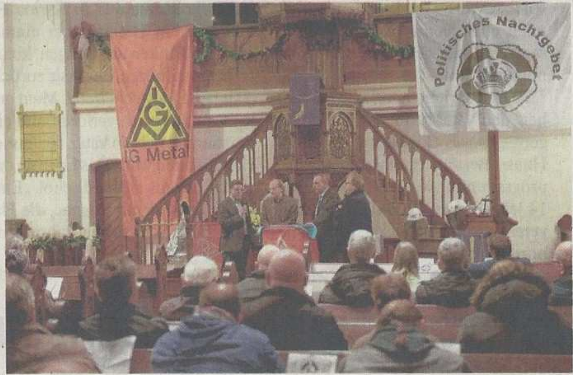
Das Interesse am Politischen Nachtgebet in der Kreuzeskirche in Marxloh war gut besucht. Einige der Gäste äußerten starke Kritik.